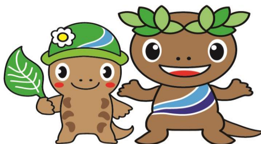
森っこサンちゃん

ふめい てん きがる と あ くだ ご不明な点がありましたら、お気軽にお問い合わせ下さい。